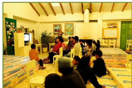
De eerste aangekomen families kijken naar een film in het kinderrestaurant

Ze aten die avond bij ons als volwassen bouwvakkers met honger, hun borden leeg. We hadden de open haard voor ze aangemaakt, warme soep geserveerd en een film aangeboden. Het was een enorm feest voor ze waarbij ze eindelijk allemaal even konden ontspannen en warm worden. Na de film hebben we de 40 matrassen (zie foto), die we die middag hadden gekocht met een vrachtwagen dekens erbij, voor ze uitgesteld en toen was het feest natuurlijk compleet.