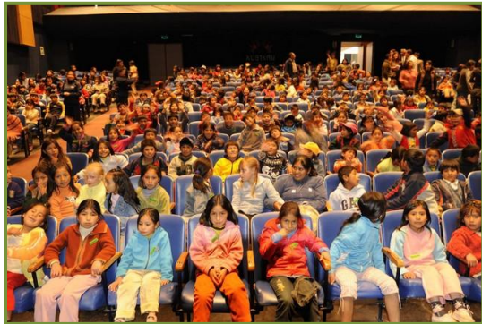
Met onze 600 kinderen in het Kusikay theater

Na 10 minuten kwam hij beledigd terug en vertelde de indruk te hebben dat het Liliane niet alleen om de kinderen te doen was geweest, maar ook om publiciteit te krijgen voor het reisbureau van haar beste vriendin.