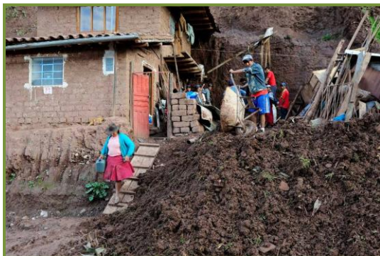
Rechts op de foto het puin waar van het voormalig huis van Carlita